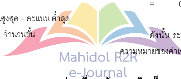
ตารางที่ 2 การแปลความหมายของค่าเฉลี่ยระดับความคิดเห็น

ความหมายของค่าเฉลี่ย ดังแสดงในตารางที่ 2